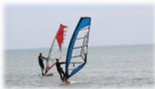
Planche à Voile Mer