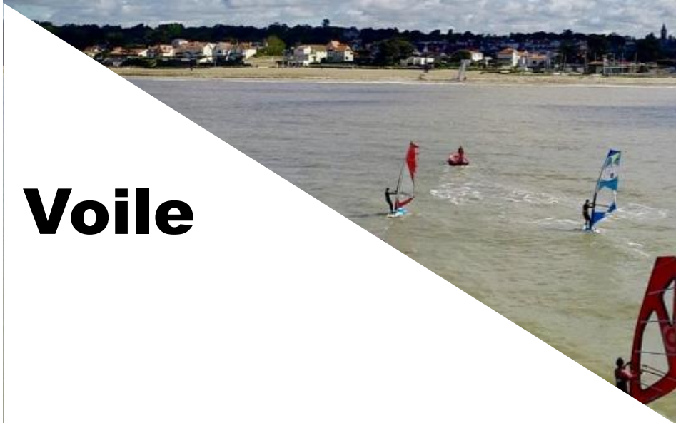
PLANCHE A VOILE Initiation / plan d'eau