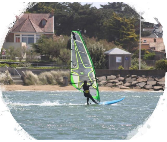
Planche Perf 1